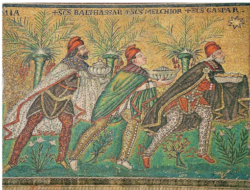
Adorazione dei Magi (dettagli) c. 526 Ravenna, Chiesa di Sant'Apollinare Nuovo

Con la nascita di Gesù veniva la Speranza , per desiderare di vivere, per poter seguire una stella, come i Magi, oggi come allora, quando il cielo chiamò a raccolta gli uomini e un angelo invitò la terra ad accogliere il dono che dall'alto arrivava.