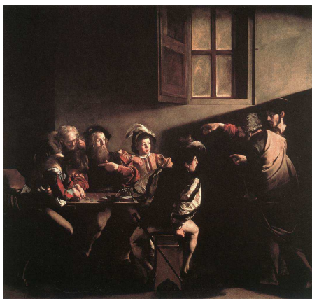
Caravaggio: Chiamata di San Matteo (San Luigi dei Francesi, Roma)

Gesù si presenta come il medico, come colui che è capace di accostarsi alla malattia degli uomini senza esserne contagiato, ma, al contrario, la elimina. È il medico venuto a portare la medicina della misericordia del Padre . Una medicina che non è proporzionata ai meriti che si hanno, ma al bisogno di essere guariti. La missione di Gesù, e quindi anche quella della Chiesa, non è quella di alzare muri di protezione, ma di abbattearli per incontrarsi col mondo ed essere "ospedale da campo".