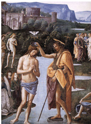
Battesimo di Cristo - Pietro Perugino Cappella Sistina, Vaticano

Mentre Gesù stava in preghiera, dopo aver ricevuto il Battesimo tra i tanti che erano attratti dalla predicazione del Precursore, si aprì il cielo e sotto forma di colomba scese su di Lui lo Spirito Santo. Risuonò in quel momento una voce dall'alto: "Tu sei il Figlio mio, l'amato: in te ho posto il mio compiacimento" (Lc 3, 22).