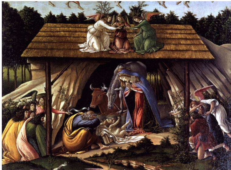
Natività - Sandro Botticelli National Gallery, Londra

F acciamo nascere Gesù nella nostra vita.