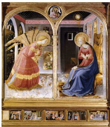
Annunciazione - Beato Angelico Santa Maria delle Grazie in San Giovanni in Valdarno

"Ecco la serva del Signore: avvenga per me secondo la tua parola" Lc 1, 26 - 38a