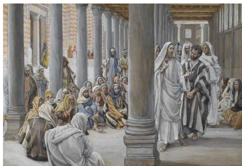
James Tissot - Gesù sotto il portico di Salomone

Secondo: vivere il tempo dell'attesa come tempo della testimonianza e della perseveranza. E noi siamo in questo tempo dell'attesa, dell'attesa della venuta del Signore». (Papa Francesco)