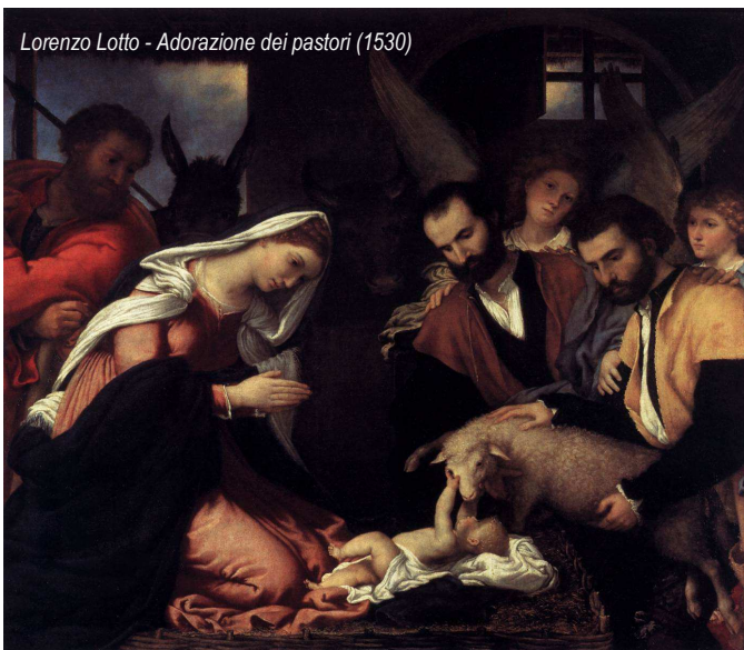
Lorenzo Lotto - Adorazione dei pastori (1530)

P otrebbe esserci capitato in questi tempi faticosi di domandare a Dio: "Dove sei? Cosa fai?". Probabilmente questa è la domanda che anche molti uomini e donne dei nostri giorni si pongono. Forse era addirittura la domanda dei pastori ai tempi di Gesù. "Dio dove sei? Siamo poveri, piccoli, al freddo e avvolti dalle tenebre".