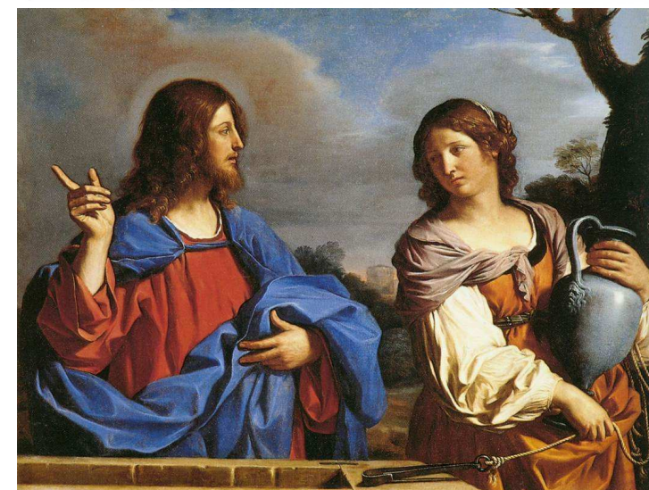
Guercini: “La donna Samaritana”

“SE RIMANETE NELLA MIA PAROLA, SIETE DAVVERO MIEI DISCEPOLI”