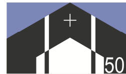
San CARLO 1966 2016

Grazie al Signore per aver guidato la popolazione che allora abitava questa zona periferica della città, e coloro che hanno dato la loro collaborazione e il loro aiuto, a desiderare che in quel luogo nascesse una chiesa.